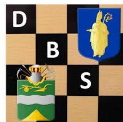
Damclub Baarn Soest

Rode Kruisgebouw Burgemeester Penstraat 6 3741AH Baarn Telefoon 06 28628058 E-mail: dam.club.baarn.soest@gmail.com Website: www.damclubbaarnsoest.nl